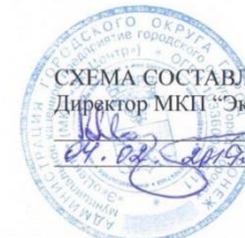
СХЕМА СОСТАВЛЕНА Директор МКП “ЭкоЦентр” А.А. Мартыненко