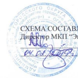
СХЕМА СОСТАВЛЕНА Директор МКП "ЭкоЦентр" А.А. Мартыненко