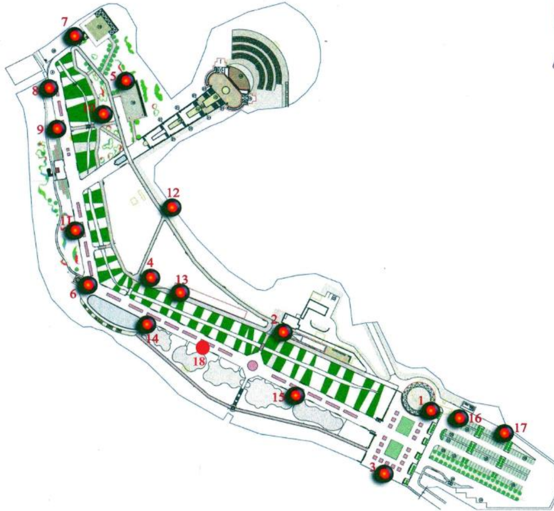
Расположение нестационарных торговых объектов на территории Воронежского центрального парка.