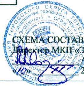
СХЕМА СОСТАВЛЕНА Директор МКП «ЭкоЦентр» [Signature] А.А. Мартыненко 2017 г.