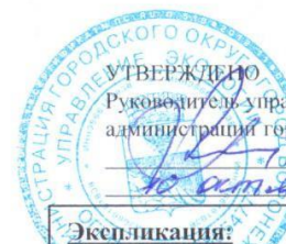
Схема №6 Размещение аттракционов в парке им. Дурова Ленинский район, г. Воронеж, ул. Ворошилова, 1м.