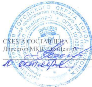
СХЕМА СОСТАВЛЕНА Директор МКУ «ЭкоЦентр» А.В. Таболин 2019 г.