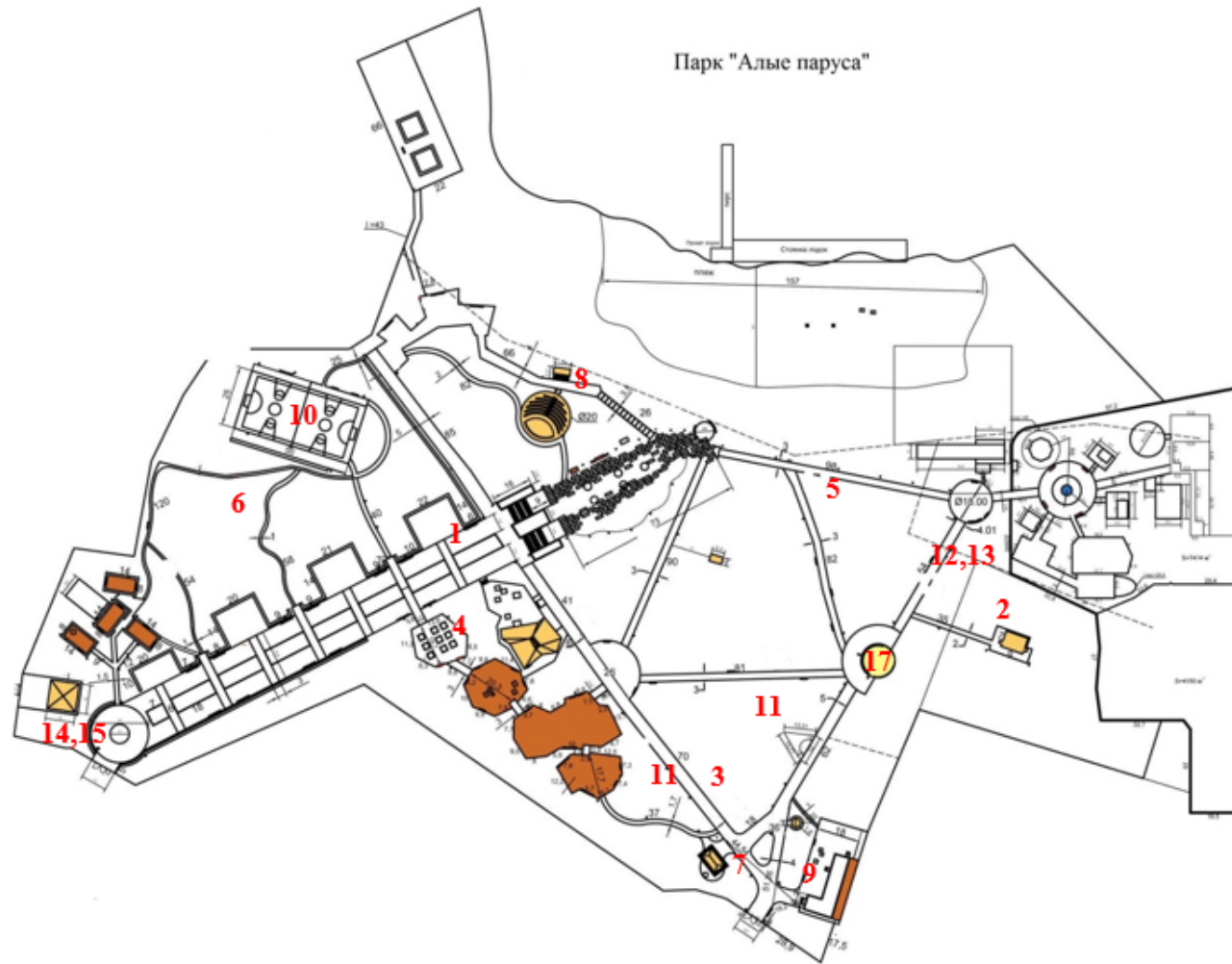
Схема размещения нестационарных объектов для организации обслуживания зон отдыха населения (ул. Арзамасская, 4д, на территории парка «Алые паруса»)